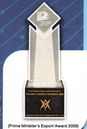
(Prime Minister's Export Award 2008)